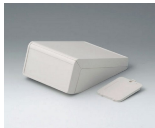
B4054227 UNITEC S, 1,4/0,6 ABS (UL 94 HB) gris blanc RAL 9002 125x177x69mm IP 40