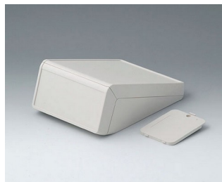
B4054217 UNITEC S, 1,4/1,4 ABS (UL 94 HB) gris blanc RAL 9002 125x177x69mm IP 40