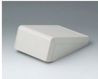
B4054107 UNITEC S, 0,6/0,6 ABS (UL 94 HB) gris blanc RAL 9002 125x177x69mm IP 40