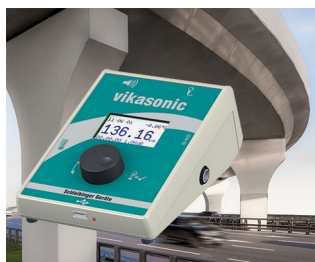
Appareil de mesure à ultrasons

Systèmes de saisie de données, terminaux d'accès et d'information, domotique, périphériques d'ordinateur, communication, applications d'analyse, de diagnostic et de thérapie, technique de mesure et de régulation et commandes industrielles.