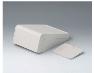
B4054337 UNITEC S, 0,6/1,4 ABS (UL 94 HB) gris blanc RAL 9002 125x177x69mm IP 40