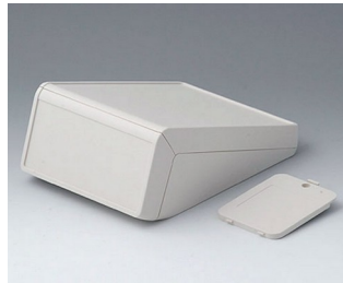
B4056217 UNITEC M, 1,4/1,4 ABS (UL 94 HB) gris blanc RAL 9002 148x210x80mm IP 40