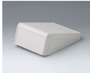
B4054127 UNITEC S, 1,4/0,6 ABS (UL 94 HB) gris blanc RAL 9002 125x177x69mm IP 40