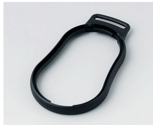
B9004306 Bague intermédiaire DM PMMA (IR) (UL 94 HB) noir RAL 9005