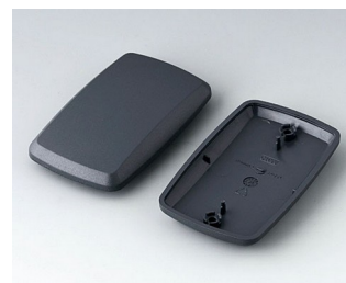
B9006858 Partie inférieure et supérieure EL ABS (UL 94 HB) lava 78x48x20mm