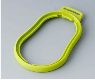
B9006304 Bague intermédiaire DL TPE vert