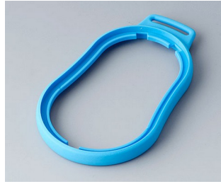
B9006305 Bague intermédiaire DL TPE bleu