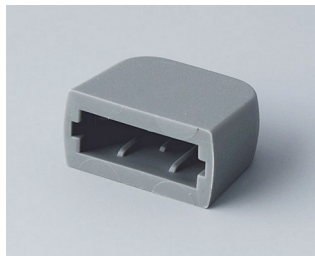
A9320008 Protection USB type A TPE volcan