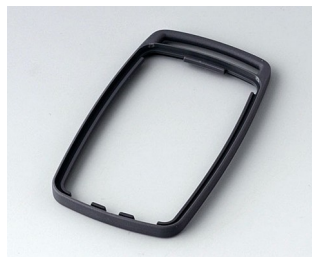
B9004702 Bague intermédiaire EM TPE lava