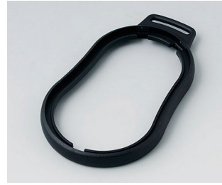
B9006306 Bague intermédiaire DL PMMA (IR) (UL 94 HB) noir RAL 9005