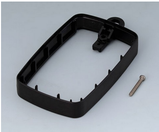
B9004786 Bague intermédiaire EM, surélevé PMMA (IR) (UL 94 HB) noir RAL 9005