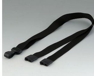
B9100073 Collier, textile noir 914x16mm

Sous réserve de modifications techniques. © OKW Gehäusesysteme, Buchen/Allemagne.