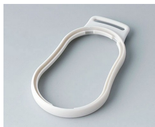
B9004307 Bague intermédiaire DM SEBS (TPE) gris blanc RAL 9002