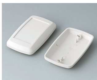
B9006817 Partie inférieure et supérieure EL ABS (UL 94 HB) gris blanc RAL 9002 78x48x24mm