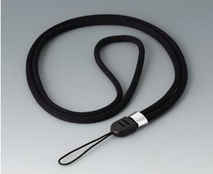
B9100063 Collier, textile noir 860mm