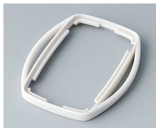
B9002757 Bague intermédiaire ES TPE gris blanc RAL 9002