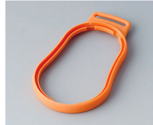
B9004303 Bague intermédiaire DM TPE orange