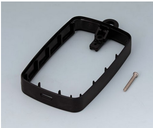
B9004776 Bague intermédiaire EM, Micro USB 5 P, B Type SMT PMMA (IR) (UL 94 HB) noir RAL 9005