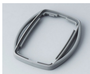
B9002758 Bague intermédiaire ES TPE volcan