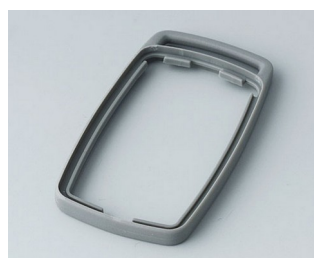
B9002708 Bague intermédiaire ES TPE volcan