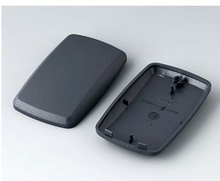
B9004858 Partie inférieure et supérieure EM ABS (UL 94 HB) lava 68x42x18mm