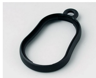
B9002359 Bague intermédiaire DS ABS (UL 94 HB) noir RAL 9005