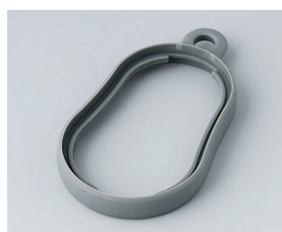
B9002358 Bague intermédiaire DS TPE volcan