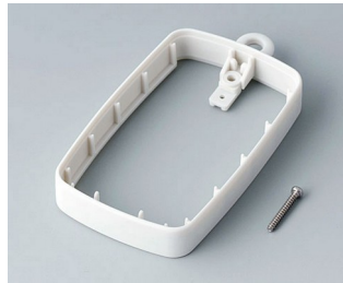
B9004787 Bague intermédiaire EM, surélevé SEBS (TPE) gris blanc RAL 9002