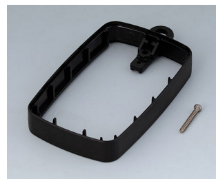
B9004789 Bague intermédiaire EM, surélevé ABS (UL 94 HB) noir RAL 9005