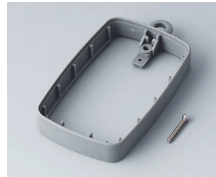
B9004788 Bague intermédiaire EM, surélevé TPE volcan