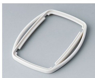
B9006757 Bague intermédiaire EL TPE gris blanc RAL 9002