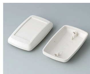
B9006827 Partie inférieure et supérieure EL ABS (UL 94 HB) gris blanc RAL 9002 78x48x26mm