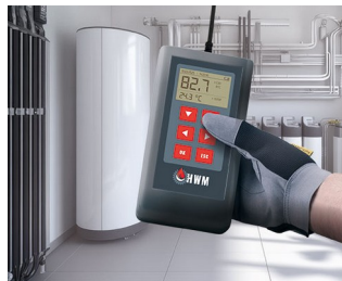
Appareil de mesure pour l'eau de chauffage