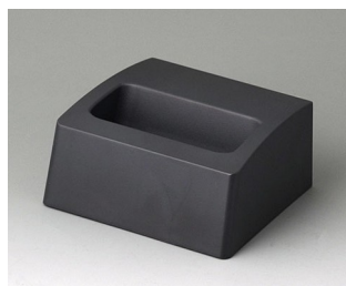
A9105508 Socle S ASA+PC (UL 94 V-0) lava