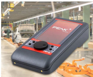
Appareil de diagnostic pour les bus CAN et CAN-FD

Saisie mobile de données, technique de mesure et de réglage, technique de commande, technique médicale et de laboratoire, une technologie respectueuse de l'environnement, utilisation à l'extérieur, smart factory, industry 4.0, etc.