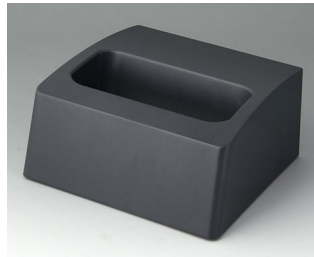
A9107508 Socle L ASA+PC (UL 94 V-0) lava