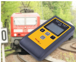
Multimètre testeur de phases