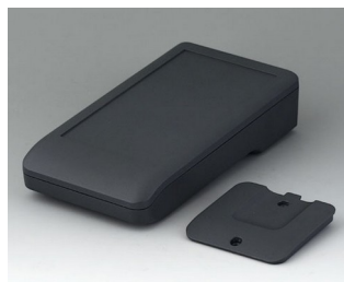
A9006208 DATEC-COMPACT M ASA+PC (UL 94 V-0) lava 172x92x39mm IP 65