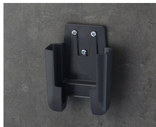
A9105628 Support S ASA+PC (UL 94 V-0) lava