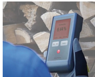
Testeur d'humidité du bois