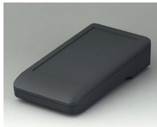
A9006108 DATEC-COMPACT M ASA+PC (UL 94 V-0) lava 172x92x39mm IP 65