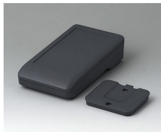
A9005208 DATEC-COMPACT S ASA+PC (UL 94 V-0) lava 136x74x32mm IP 65