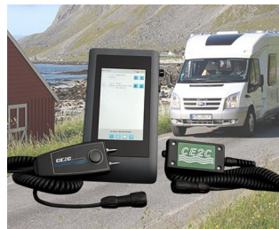
SYSTÈME DE CONTRÔLES DE PRESENCE D'HUMIDITE