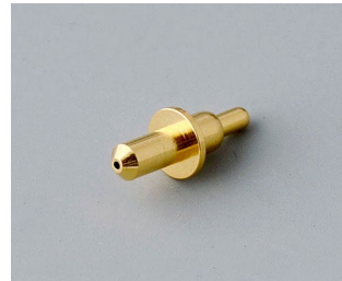
A9193031 Contact à ressort doré