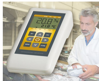
Instrument de mesure de l'oxygène de l'air