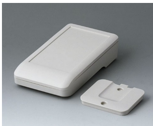
A9005207 DATEC-COMPACT S ASA+PC (UL 94 V-0) gris blanc RAL 9002 136x74x32mm IP 65