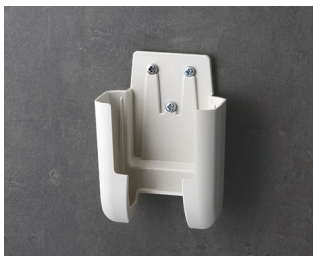
A9105627 Support S ASA+PC (UL 94 V-0) gris blanc RAL 9002