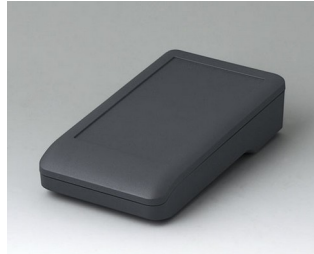
A9005108 DATEC-COMPACT S ASA+PC (UL 94 V-0) lava 136x74x32mm IP 65