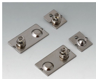
A9190024 Ressorts de contact, 3 x AAA Acier nickelé