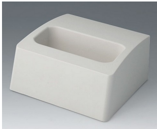
A9107507 Socle L ASA+PC (UL 94 V-0) gris blanc RAL 9002