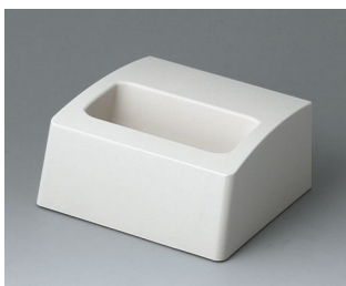
A9105507 Socle S ASA+PC (UL 94 V-0) gris blanc RAL 9002