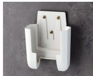
A9106627 Support M ASA+PC (UL 94 V-0) gris blanc RAL 9002