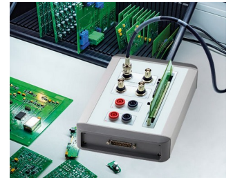
Contrôle de qualité des composants électroniques