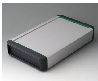
B3407031 SMART-TERMINAL 240 Aluminium AlMgSi 0,5 anodisé mat 282x170x50mm IP 54