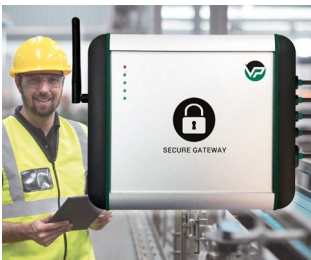
Industrial Secure Gateway