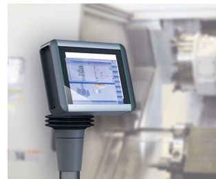
Panneau multi-touch pour le contrôle de la machine