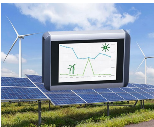
Système intelligent pour l'énergie éolienne et les systèmes solaires