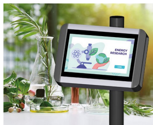
Terminal de recherche végétale