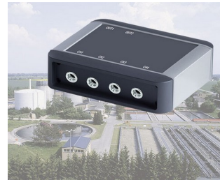
Contrôle de processus des usines