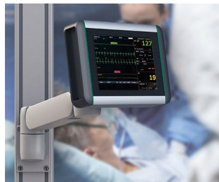
Moniteur de surveillance des signes vitaux