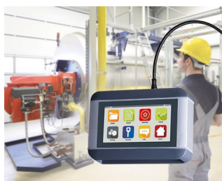
Appareil de diagnostic mobile pour machines