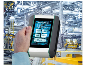
Système de surveillance en temps réel de la machine