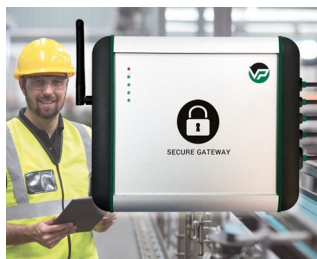
Industrial Secure Gateway