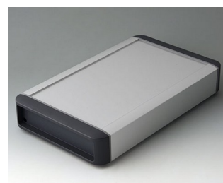
B3407032 SMART-TERMINAL 240 Aluminium AlMgSi 0,5 anodisé mat 282x170x50mm IP 54