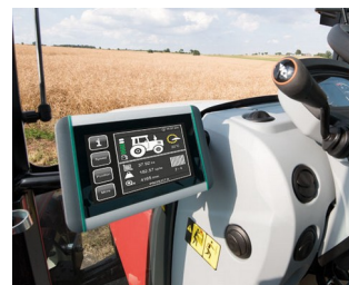
Terminal ISOBUS pour tracteurs et machines agricoles