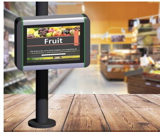
Borne d'information dans les points de vente