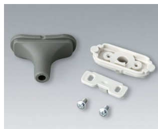
B2911328 Kit passe-câbles, 5,0 - 5,9 SEBS (TPE) volcan