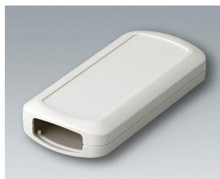
B2833107 CONNECT ASA+PC-FR (UL 94 V-0) gris blanc RAL 9002 116x54x22mm IP 40