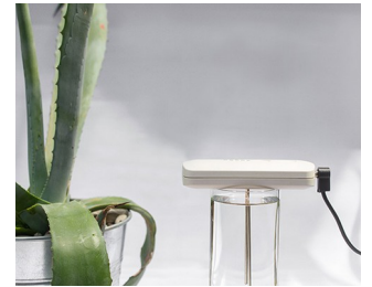
Production de solutions d'argent colloïdal