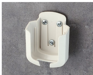
B2931507 Support M ASA+PC (UL 94 V-0) gris blanc RAL 9002