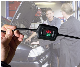
Affichage de la tension et du courant en mode maintien de charge

Périphérique d'ordinateurs, technique de réseau, technique des bâtiments, technique de sécurité, IoT/ IIoT, applications médicales et thérapeutiques, instruments d'analyse en laboratoire, technique de mesure, entre autres détecteurs avec sonde de mesure, systèmes/instruments de test, enregistreurs de données dans la technique environnementale, produits de technique énergétique et sensorique, etc.