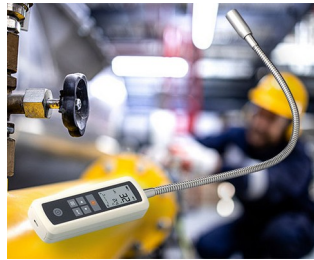
Détecteur de fuite de gaz