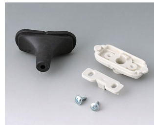
B2911309 Kit passe-câbles, 3,4 - 4,2 SEBS (TPE) noir RAL 9005