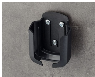
B2931509 Support M ASA+PC (UL 94 V-0) noir RAL 9005