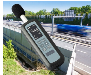
Mesure du niveau de bruit