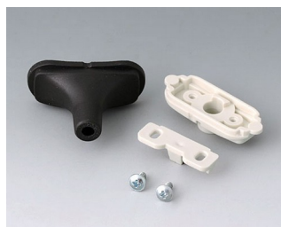
B2911319 Kit passe-câbles, 4,2 - 5,0 SEBS (TPE) noir RAL 9005