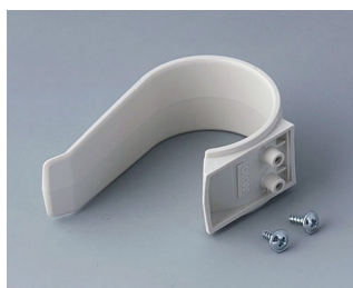
A9167027 Étrier de retenue PA 6 (UL 94 HB) gris blanc RAL 9002