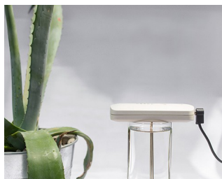
Production de solutions d'argent colloïdal

Périphérique d'ordinateurs Technique de réseau Technique des bâtiments Technique de sécurité Applications médicales et thérapeutiques Technique de mesure et de régulation