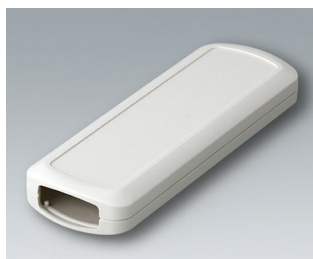
B2834107 CONNECT ASA+PC-FR (UL 94 V-0) gris blanc RAL 9002 156x54x22mm IP 40