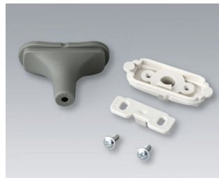
B2911308 Kit passe-câbles, 3,4 - 4,2 TPE volcan