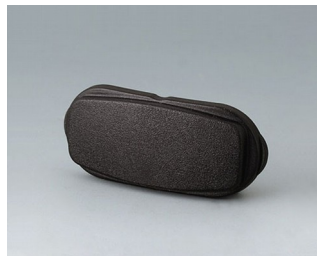
B2811209 Élément d'extrémité ASA+PC-FR (UL 94 V-0) noir RAL 9005