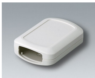
B2832107 CONNECT ASA+PC-FR (UL 94 V-0) gris blanc RAL 9002 76x54x22mm IP 40