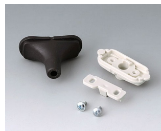
B2911329 Kit passe-câbles, 5,0 - 5,9 SEBS (TPE) noir RAL 9005