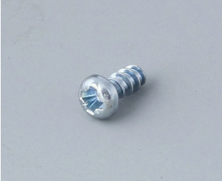
A0304031 Vis Autotaraudeuses 2,2 x 5 mm (PZ1)

Sous réserve de modifications techniques.