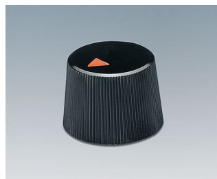
A1316240 BOUTON, à fixation latérale par vis ABS (UL 94 HB) noir RAL 9005 16,4x12,3mm 4mm