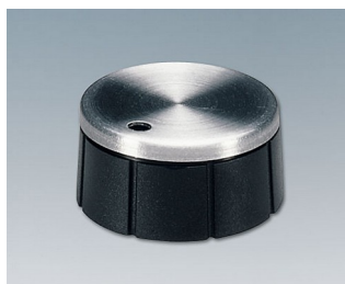
A1321260 BOUTON, à fixation latérale par vis PF noir/alu 21x10mm 6mm