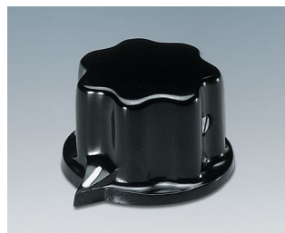
A1321060 BOUTON, à fixation latérale par vis PF noir RAL 9005 31x20mm 6mm