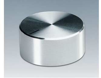
A1418461 BOUTON, à fixation latérale par vis ABS (UL 94 HB) brillant 17,8x12mm 6mm