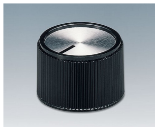
A1320260 BOUTON, à fixation latérale par vis PF noir/alu 20x16mm 6mm