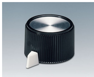
A1318560 BOUTON, à fixation latérale par vis PF noir/alu 23,9x16mm 6mm