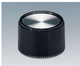
A1328160 BOUTON, à fixation latérale par vis PF noir/alu 28x16mm 6mm