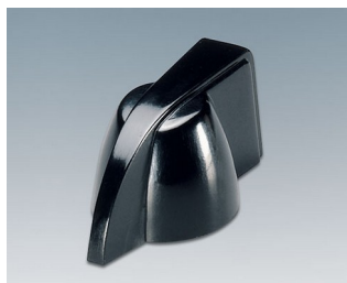
A1319860 BOUTON, à fixation latérale par vis PF noir RAL 9005 20,3x18mm 6mm