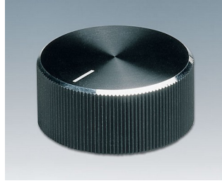
A1418260 BOUTON, à fixation latérale par vis ABS (UL 94 HB) noir/alu 18,6x12mm 6mm