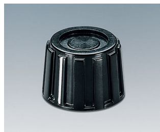
A1319260 BOUTON, à fixation latérale par vis PF noir RAL 9005 18,9x13,5mm 6mm