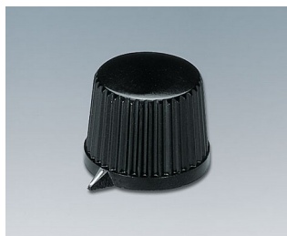
A1313560 BOUTON, à fixation latérale par vis PF noir RAL 9005 20x15,4mm 6mm