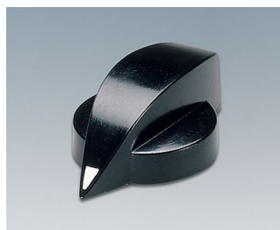
A1321860 BOUTON, à fixation latérale par vis PF noir RAL 9005 23x16mm 6mm