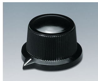
A1319560 BOUTON, à fixation latérale par vis PF noir RAL 9005 29x20,1mm 6mm