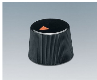
A1316240 BOUTON, à fixation latérale par vis ABS (UL 94 HB) noir RAL 9005 16,4x12,3mm 4mm