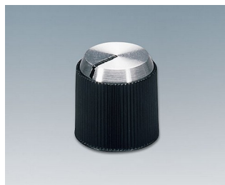
A1314240 BOUTON, à fixation latérale par vis PF noir/alu 14,1x14mm 4mm