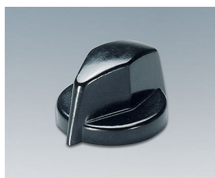
A1311860 BOUTON, à fixation latérale par vis PF noir RAL 9005 18,8x12,5mm 6mm