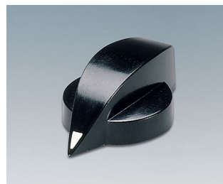
A1317860 BOUTON, à fixation latérale par vis PF noir RAL 9005 20,3x12,8mm 6mm