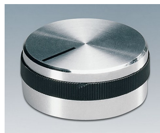
A1432469 BOUTON, à fixation latérale par vis ABS (UL 94 HB) brillant 31,9x14mm 6mm