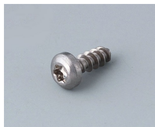
A0308132 Vis autotaraudeuse 3 x 8 mm (T10) Acier inoxydable

Sous réserve de modifications techniques. © OKW Gehäusesysteme, Buchen/Allemagne.