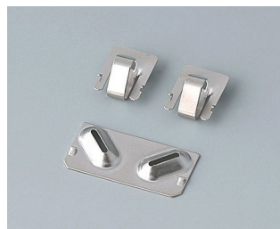
A9190003 Resorts de contact, 2xN/2xAA/2xAAA Acier nickelé