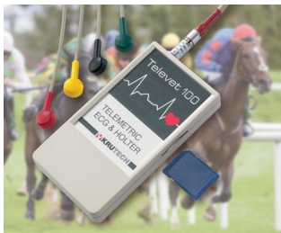
Système télémetrique ECG pour la médecine vétérinaire

Idéal pour les générateurs et récepteur d'impulsions, technique de mesure et de régulation, générateurs d'impulsions pour ultrasons et infrarouges, capteurs, optoélectronique, télécommandes de tout genre, communication sans fil, saisie mobile de données, etc.