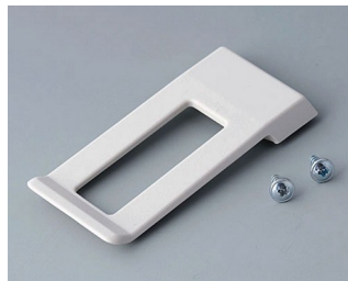
A9172107 Clip de poche ABS (UL 94 HB) gris blanc RAL 9002 62x30mm