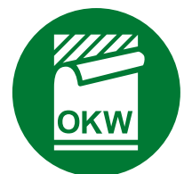
Étiquette, Films de décoration graphique