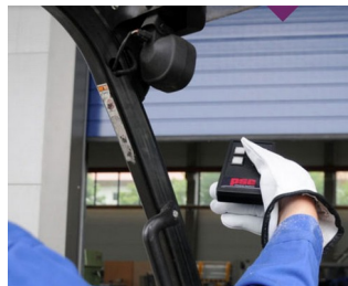
Télécommande IR pour environnements rudes