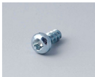
A0305031 Vis autotaraudeuses 2,5 x 6 mm (PZ1)

Sous réserve de modifications techniques. © OKW Gehäusesysteme, Buchen/Allemagne.