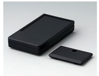
A9071219 DATEC-POCKET-BOX M PMMA (IR) (UL 94 HB) noir RAL 9005 105x58x18,5mm IP 54