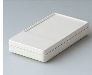
A9070117 DATEC-POCKET-BOX S ABS (UL 94 HB) gris blanc RAL 9002 85x46x16mm IP 54