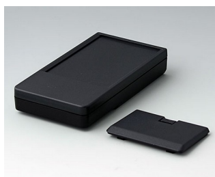
A9072229 DATEC-POCKET-BOX L PMMA (IR) (UL 94 HB) noir RAL 9005 120x65x22mm IP 41