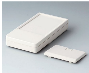
A9072127 DATEC-POCKET-BOX L ABS (UL 94 HB) gris blanc RAL 9002 120x65x22mm IP 41