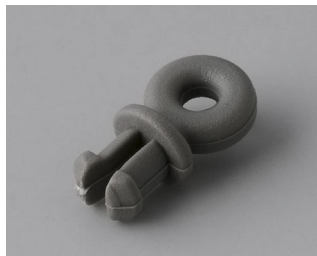
A9100001 Anneau PA 6 volcan