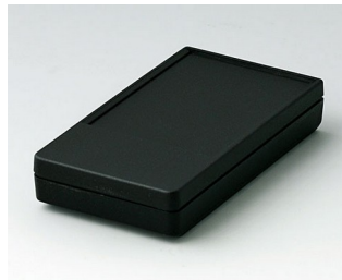
A9070219 DATEC-POCKET-BOX S PMMA (IR) (UL 94 HB) noir RAL 9005 85x46x16mm IP 54