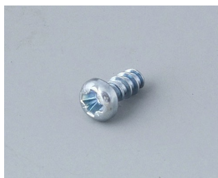
A0304031 Vis Autotaraudeuses 2,2 x 5 mm (PZ1)