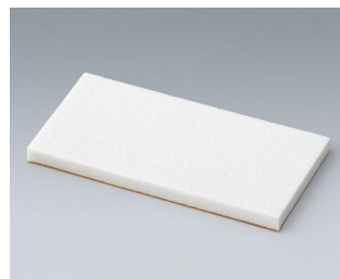
A9250251 Pièce de maintien PE cellulaire 50x25x3mm