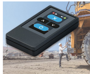
Émetteur radio pour machines