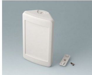
B4608207 SMART-CONTROL S, Vers. II ASA+PC (UL 94 V-0) gris blanc RAL 9002 142x81x46mm IP 55 opt., IP 40