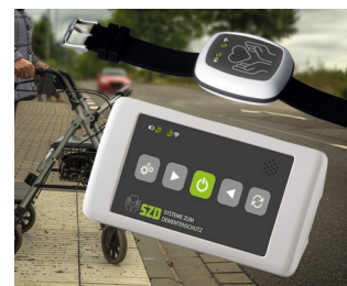
Solution de sécurisation des personnes vulnérables