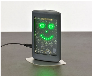
Appareil de mesure de l'air intérieur

Technique de sécurité et de surveillance, technologie environnementale, IoT/IIoT, passerelles, technique de mesure et de commande, technologie des capteurs, technique de régulation, technique médicale et de laboratoire, etc.