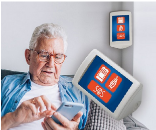
Système d'assistance AAL