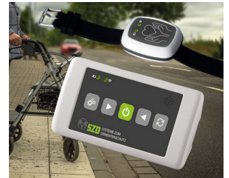
Solution de sécurisation des personnes vulnérables