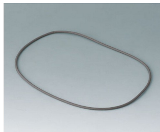
B4710920 Joint M