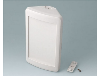
B4610207 SMART-CONTROL M, Vers. II ASA+PC (UL 94 V-0) gris blanc RAL 9002 173x101x59mm IP 55 opt., IP 40