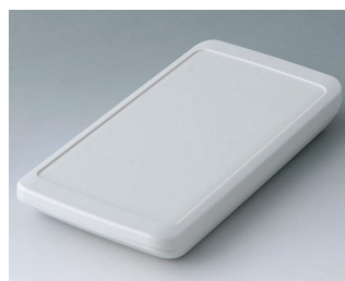
B5403207 SLIM-CASE M, Vers. II ASA+PC (UL 94 V-0) gris blanc RAL 9002 148x74x19mm IP 65 opt., IP 40