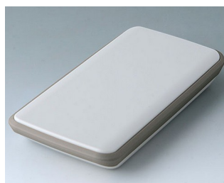
B5403117 SLIM-CASE M, Vers. IV ASA+PC (UL 94 V-0) gris blanc RAL 9002 148x74x22mm IP 54