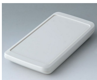
B5403307 SLIM-CASE M, Vers. III ASA+PC (UL 94 V-0) gris blanc RAL 9002 148x74x19mm IP 65 opt., IP 40