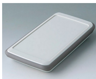
B5403317 SLIM-CASE M, Vers. VI ASA+PC (UL 94 V-0) gris blanc RAL 9002 148x74x22mm IP 54