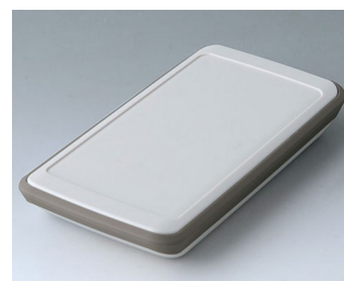
B5403217 SLIM-CASE M, Vers. V ASA+PC (UL 94 V-0) gris blanc RAL 9002 148x74x22mm IP 54