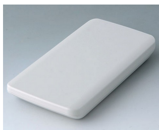
B5403107 SLIM-CASE M, Vers. I ASA+PC (UL 94 V-0) gris blanc RAL 9002 148x74x19mm IP 65 opt., IP 40