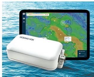
Collecte de données pour l'observation des océans