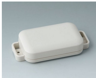
C3204107 EASYTEC 80 ASA+PC (UL 94 V-0) gris blanc RAL 9002 101x50x22mm IP 65 opt., IP 40