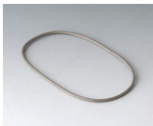
A9500030 Joint 80