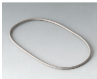
A9502030 Joint 100