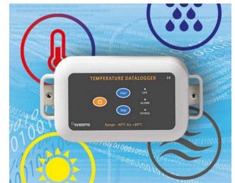
Enregistreur de données par ex. température