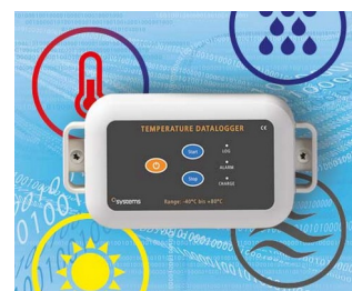
Enregistreur de données par ex. température