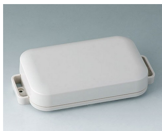
C3207107 EASYTEC 125 ASA+PC (UL 94 V-0) gris blanc RAL 9002 147x78x30mm IP 65 opt., IP 40