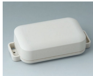
C3206207 EASYTEC 100 ASA+PC (UL 94 V-0) gris blanc RAL 9002 121x62x31mm IP 65 opt., IP 40