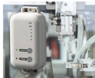
Enregistreur de données avec fonction de passerelle