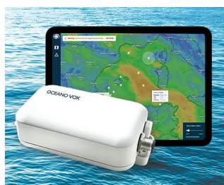
Collecte de données pour l'observation des océans