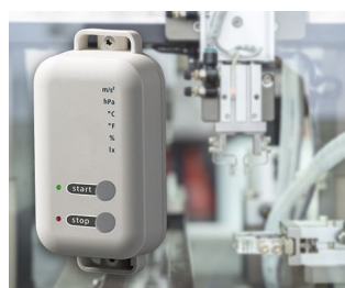
Enregistreur de données avec fonction de passerelle