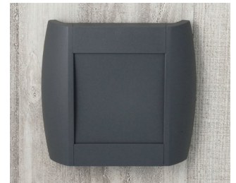
A9093108 DIATEC S ABS (UL 94 HB) lava 210x48x200mm IP 40