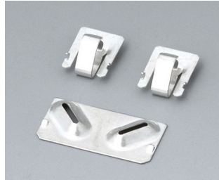
A9190002 Ressorts de contact, 2xN/2xAA/2xAAA Acier étamé