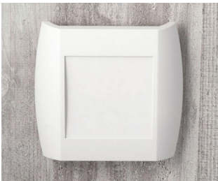
A9092107 DIATEC XS ABS (UL 94 HB) gris blanc RAL 9002 150x37x155mm IP 40