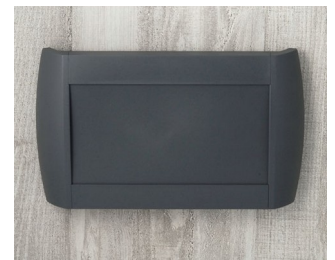
A9095108 DIATEC L ABS (UL 94 HB) lava 330x48x200mm IP 40