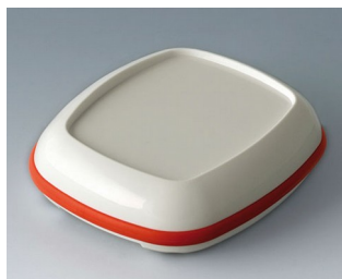
B1606207 BODY-CASE L, avec zone en creux ASA (UL 94 HB) blanc signalisation RAL 9016 55x46x17mm IP 65