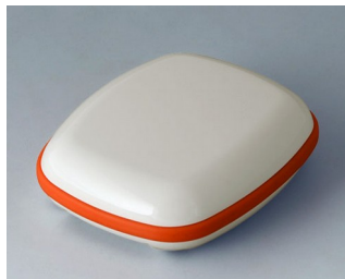
B1604107 BODY-CASE M, sans zone en creux ASA (UL 94 HB) blanc signalisation RAL 9016 50x41x16mm IP 65