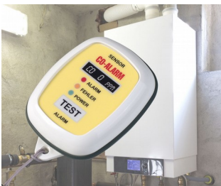
Appareil d'alarme de gaz CO