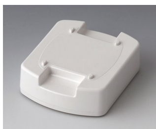
B1704017 Station d'accueil M ASA (UL 94 HB) blanc signalisation RAL 9016 62x50x17mm