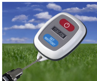
Appareils de suivi avec GPS