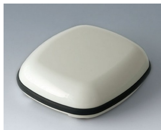
B1606117 BODY-CASE L, sans zone en creux ASA (UL 94 HB) blanc signalisation RAL 9016 55x46x17mm IP 65