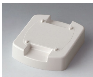
B1704807 Station de chargement M (configuration individualisée) ASA (UL 94 HB) blanc signalisation RAL 9016 62x50x17mm