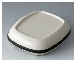
B1606217 BODY-CASE L, avec zone en creux ASA (UL 94 HB) blanc signalisation RAL 9016 55x46x17mm IP 65