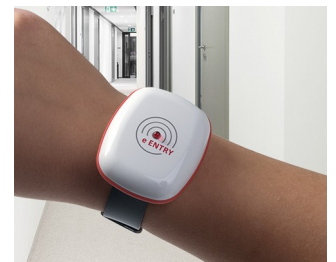
eEntry contrôle d'accès