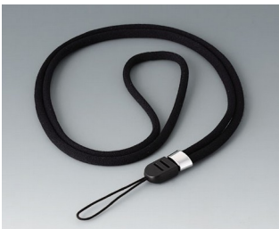
B9100063 Collier, textile noir 860mm