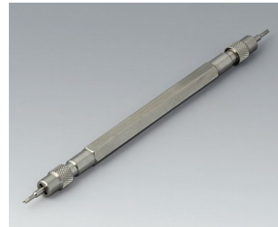
B1706203 Outil pour barrette à ressort Acier inoxydable