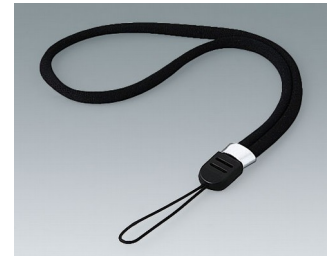
B9100043 Dragonne, textile noir 200mm