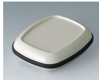
B1604217 BODY-CASE M, avec zone en creux ASA (UL 94 HB) blanc signalisation RAL 9016 50x41x16mm IP 65