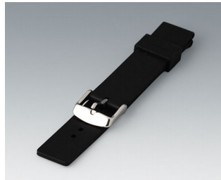
B1706202 Bracelet, 18 mm Silicone noir