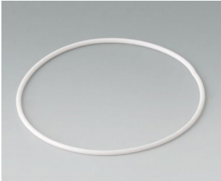
B1706003 Joint M/L