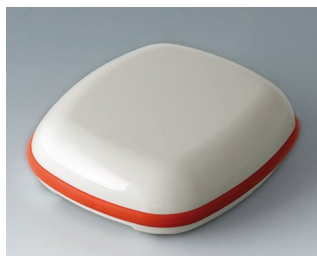
B1606107 BODY-CASE L, sans zone en creux ASA (UL 94 HB) blanc signalisation RAL 9016 55x46x17mm IP 65