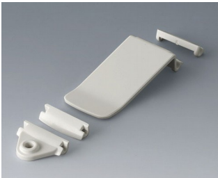
B1706001 Kit de fixation ASA (UL 94 HB) blanc signalisation RAL 9016