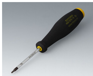
A0399T06 Tournevis Torx T6

Sous réserve de modifications techniques.