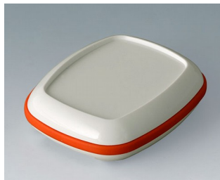
B1604207 BODY-CASE M, avec zone en creux ASA (UL 94 HB) blanc signalisation RAL 9016 50x41x16mm IP 65