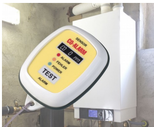
Appareil d'alarme de gaz CO

Saisie mobile et transfert de données Technologie intelligente IoT/ IIoT Appareils de suivi et de contrôle Systèmes d'appel d'urgence et d'information ainsi que pour les capteurs de biofeedback (de rétrocontrôle) dans les domaines de la santé, de la technique médicale, thérapeutiques et sociaux Loisirs et du sport Technique de communication numérique Logistique d'entrepôts et de distribution Technique de sécurité Mesure et de régulation Domaine de l'automatisation Postes de travail qui requièrent une localisation permanente