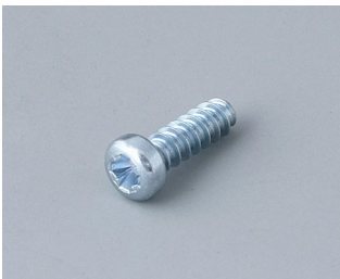
A0325080 Vis autotaraudeuses 2,5 x 8 mm (PZ1)