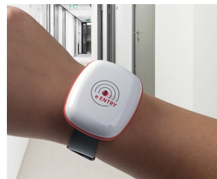
eEntry contrôle d'accès